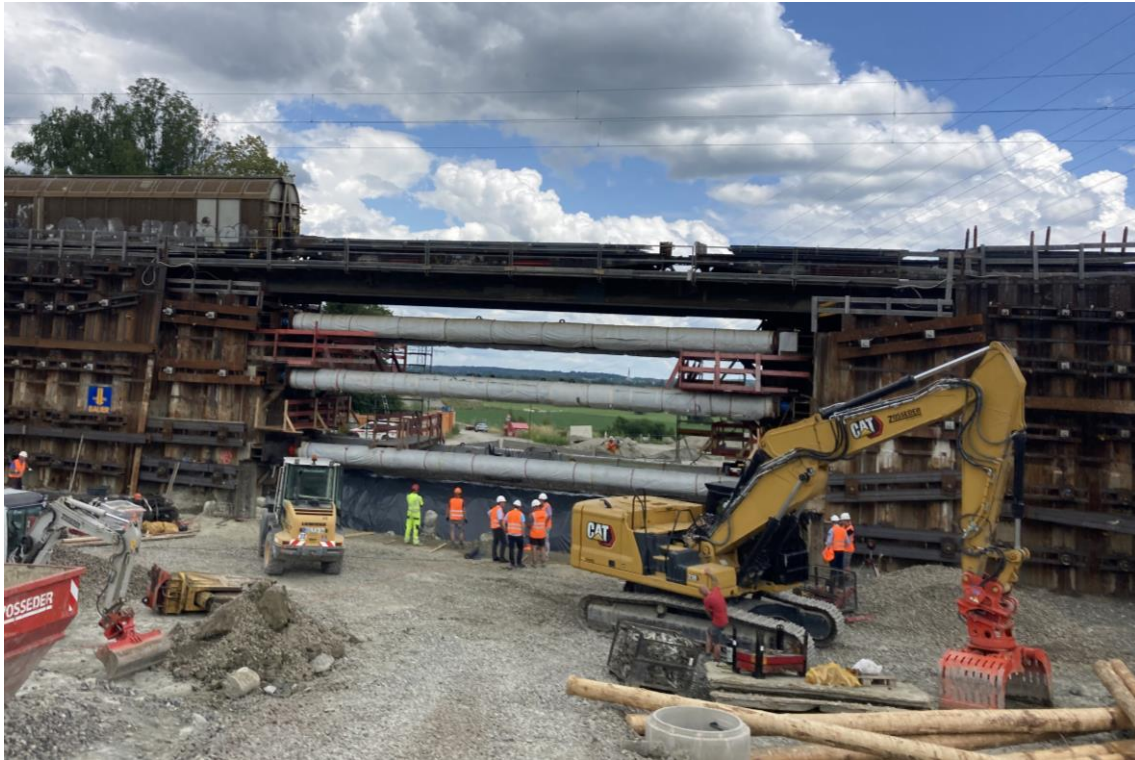
Verbaumaßnahmen für den kommenden Brückenbau in Wernhardsberg

Eine weitere Herausforderung, die durch den gewählten Trassenverlauf entstand, ist die Unterquerung der Bahnlinie München – Rosenheim bei Wernhardsberg. Dieser Streckenabschnitt gehört zu einer der bedeutendsten Bahnstrecken im süddeutschen Raum und ist Teil des europäischen Streckennetzes (aktueller Brenner-Nordzulauf). Die Errichtung des Brückenbauwerks muss daher unter ständigem Weiterbetrieb der Bahnstrecke erfolgen, sozusagen „unter rollendem Rad“. Dementsprechend hoch sind hier die Auflagen an die Sicherheit und die Überwachung der Gleise.