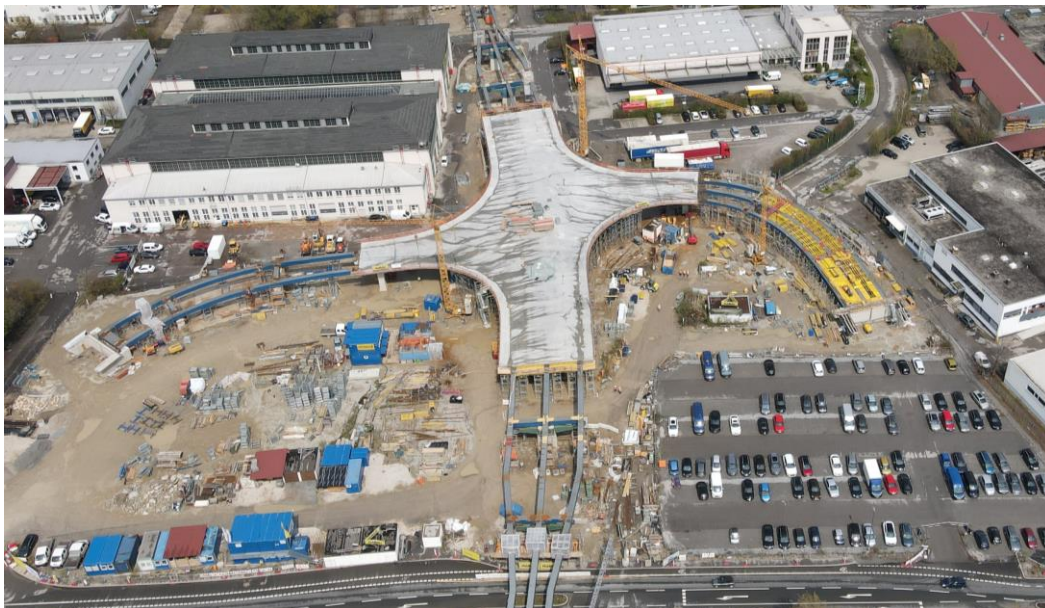
Bau der Aicherparkbrücke mit obenliegender Anschlussstelle

Mit der Überquerung des gesamten Areals wurde nun ein weiterer Sonderfall notwendig: Eine Anschlussstelle zur Westtangente auf der Aicherparkbrücke. Ein absoluter Ausnahmefall und höchst anspruchsvoll in der Umsetzung. Jedes Bauwerk unterliegt mit dem Temperaturwechsel einer gewissen Ausdehnung und Stauchung. Bei einem Temperaturunterschied von 40 Kelvin zwischen Sommer und Winter führt dies bei der Aicherparkbrücke zu einer Ausdehnung bzw. Stauchung von über 30 cm in Längsrichtung. Durch die obenliegende Anschlussstelle hat die Aicherparkbrücke aber nun auch eine erhebliche Temperatursausdehnung in Richtung der Verbindungsarme: Dies musste durch eine aufwendige Lagerführung ausgeglichen werden.